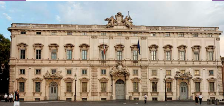
La sede della Corte Costituzionale.

Dal riconoscimento della condizione derivano una serie di importanti diritti per la vittima particolarmente vulnerabile (cui corrispondono specifici obblighi in capo all'autorità e alla polizia giudiziaria), che si aggiungono alla più generale tutela riconosciuta a tutte le vittime: essere informate; avere un ruolo attivo nel procedimento penale; veder riconosciuti rispetto, protezione, ascolto; aiuto nell'accesso alla giustizia; rimborsi economici e supporto psicologico 15 .